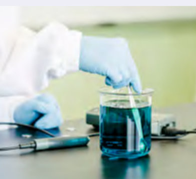
Operatore della gestione delle acque e risanamento ambientale