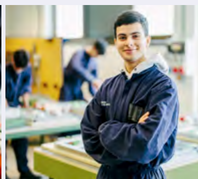
Tecnico per l'automazione industriale