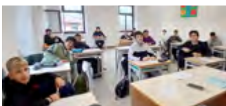
I ragazzi della classe prima sez. B